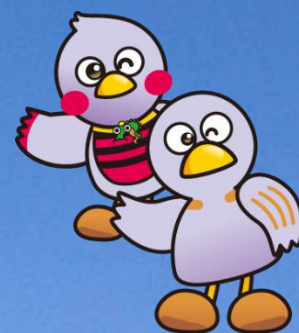
さいたまっち&コバトン

主催 埼玉県 対象 県内中小事業者・業界団体、医療・福祉法人、農業者、 行政関係者など 参加費 無料 開催方法 Microsoft Teams によるウェブ方式